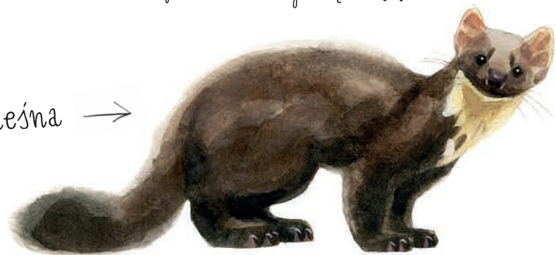
kuna leśna →

Chociaż nigdy ich nie widzieliśmy, wiemy, że mieszkają u nas na strychu, bo bardzo hatasują. Szczególnie ich kłótnie małżeńskie i nocne gonitwy po dachu bardzo dają się nam we znaki.