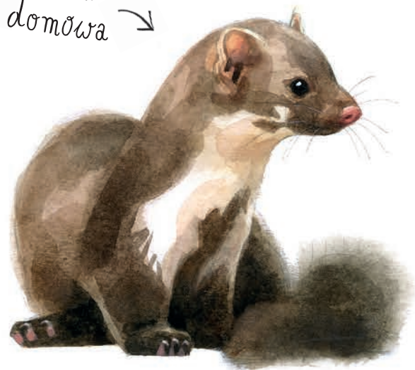
← kuna domowa →

← Pewnego razu dostaliśmy od kun taki oto... pakunek.