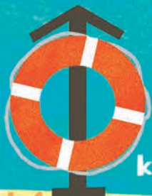
lifebelt koło ratunkowe