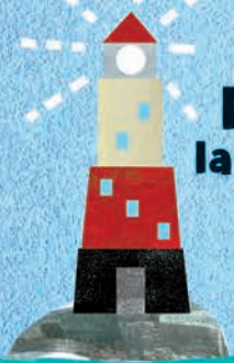
lighthouse latarnia morska