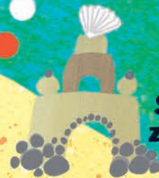
sandcastle zamek z piasku