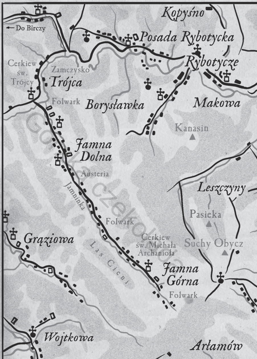
Część majątku Tyszkowskich w połowie XIX wieku